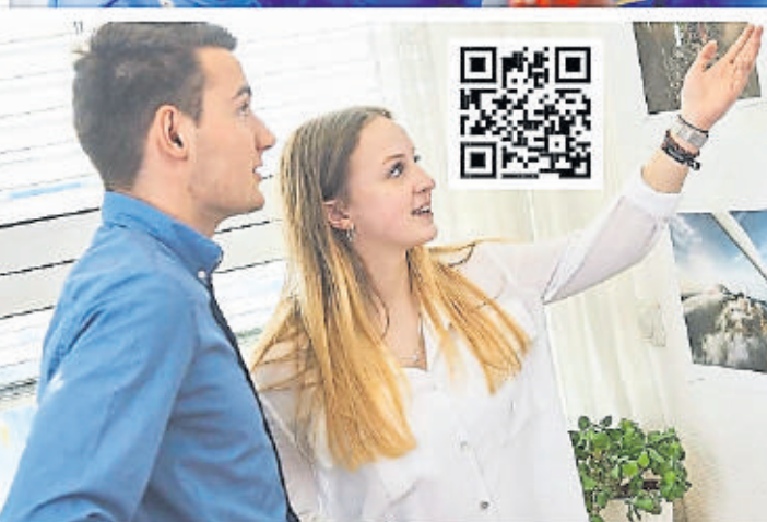
Die Ausbildungsberufe bei Vesuvius sind vielfältig - da ist für jeden etwas dabei.