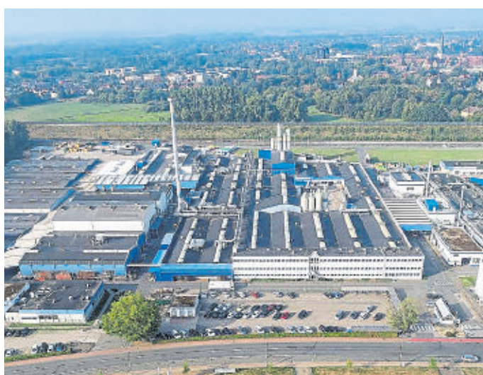
Am Vesuvius-Standort Borken arbeiten rund 700 Mitarbeiter.

Und selbstverständlich kümmern wir uns auch noch um die Prozesse und deren optimale Steuerung, denn: zum Beispiel Bremscheiben oder Stahlträger müssen für ihre spätere Aufgabe perfekt sein. Unsere Kunden vertrauen dabei auf unsere Lösungen, die wir speziell für ihre Anforderungen entwickeln.