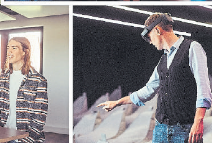
netgo hat einiges zu bieten: Nicht nur ein eigenes Kino, auch ein Fitness-Studio gibt es.