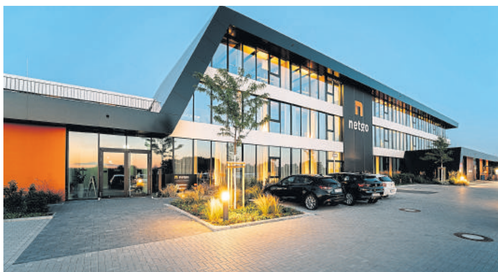
Das „Basecamp“ an der Weseler Straße wurde 2019 eröffnet.

Wenn du mehr über die beruflichen Möglichkeiten bei netgo erfahren möchtest, mache ein digitales Date aus oder schau auf https://www.netgo.de/unternehmen/jobs/ .